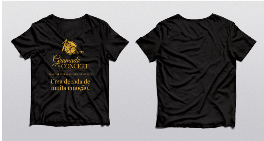
Modelo referência para camisetas do 10° Gramado in Concert.